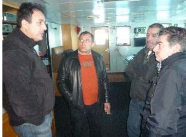
Dos inspectores de ITF, además de responsables de la CIG, subieron al barco ayer para interesarse por la tripulación. MARU

Nadie parecía mover ficha para desbloquear la inmovilización del buque vasco “Bermeotarrak Cuatro”, a excepción de los marineros y el sindicato que los representa. Sin embargo, al escrito remitido por el capitán solicitando a la Autoridad Portuaria que les permita atracar por razones humanitarias, de seguridad y salud, respondieron desde la Marina Mercante enviando ayer a dos inspectores, junto con responsables de la Capitanía Marítima de A Pobra y de la jefatura de distrito riveirense.