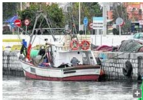
Un barco pesquero atracado en el puerto de Algeciras, en una imagen de archivo.

La UE y Marruecos debatirán en Rabat, entre el martes y miércoles de la próxima semana, sobre los "problemas" del acuerdo pesquero, la falta de justificación marroquí del dinero recibido y cuestiones sobre el Sahara, anunció ayer la ministra española del